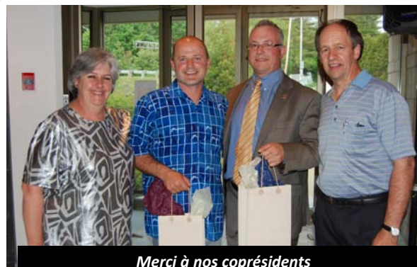
Merci à nos coprésidents