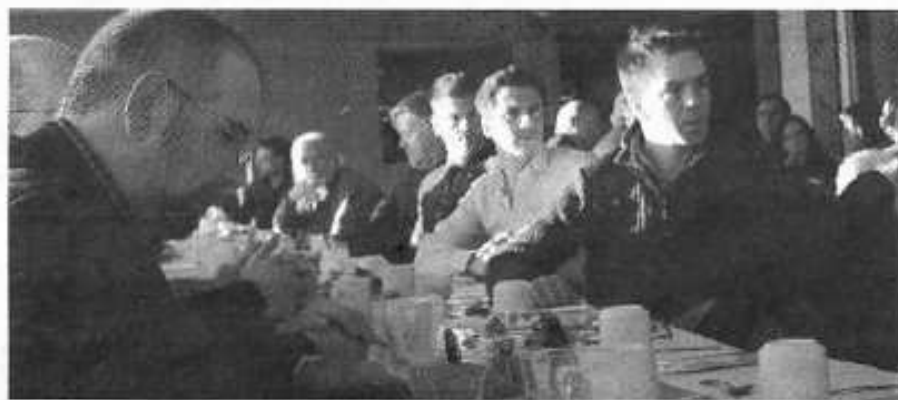
43 personnes ont assisté au déjeuner-conférence.