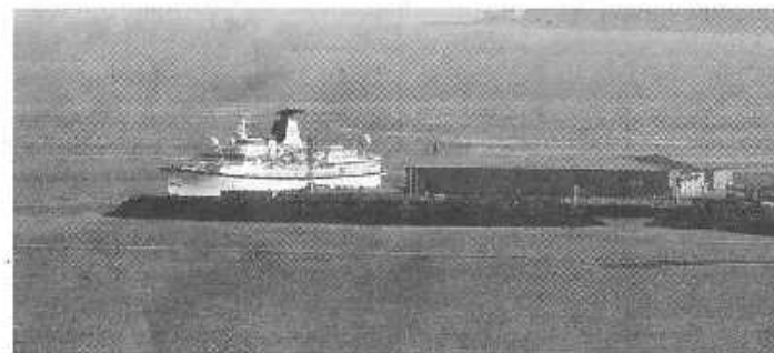
quais à la SOGIT (Société de gestion des infrastructures de transport), qui devrait être réalisée en 2011.

Ces résultats démontrent toutefois que la municipalité de La Malbaie a intérêt à maintenir le quai en bon état puisque cette infrastructure pourra être utilisée davantage dans les années à venir. Rappelons que seulement la face ouest du quai est présentement utilisée puisque la face est devra être refaite lors de la cession des