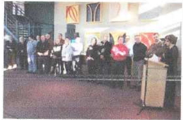
Une quinzaine d'organisations, municipalités et entreprises ont signé la Charte du bois.

La traçabilité est aussi au cœur du mandat de la Coalition Bois. « On sait que les gens achètent d'abord le prix, mais il faut comprendre que si le plancher chinois est si peu cher, c'est parce qu'il est coupé illégalement. Il y a une question d'éthique là-dedans. On veut que ça devienne socialement inacceptable de ne pas considérer le bois québécois d'abord dans tous les projets de construction.