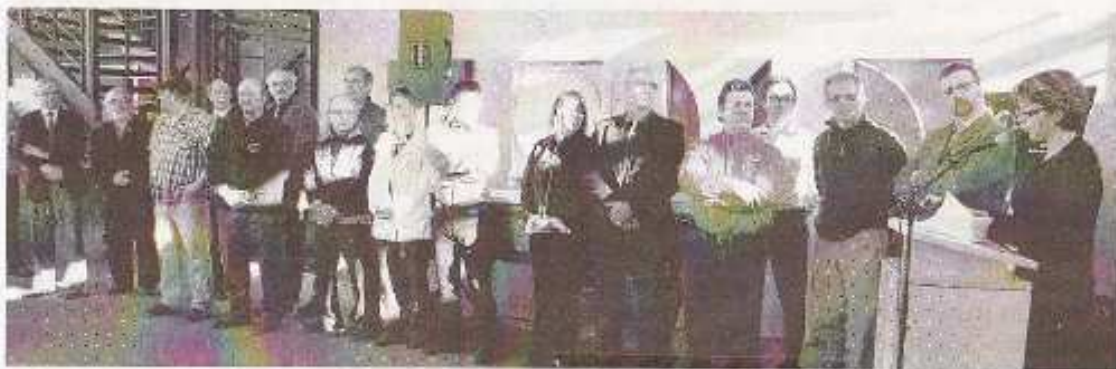
En tout 16 entreprises, municipalités et organisations ont déjà signé la Charte du bois.

La traçabilité est aussi au cœur du mandat de la Coalition Bois. « On sait que les gens achètent d'abord le prix, mais il faut comprendre que si le plancher chinois est si peu cher, c'est parce qu'il est coupé illégalement. Il y a une question d'éthique là-dedans. On veut que ça devienne socialement inacceptable de ne pas considérer le bois québécois d'abord dans