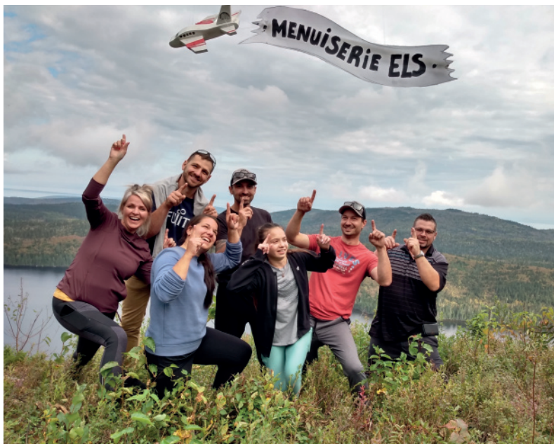
Équipe de Menuiserie ELS au sommet du Mont Grand-Fonds

Défi des 5 sommets, MicroBrasserie Charlevoix, Mont Grand-Fonds