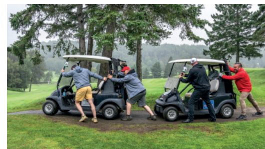
L'équipe des Viandes bios mime l'enlèvement en cette journée pluvieuse!