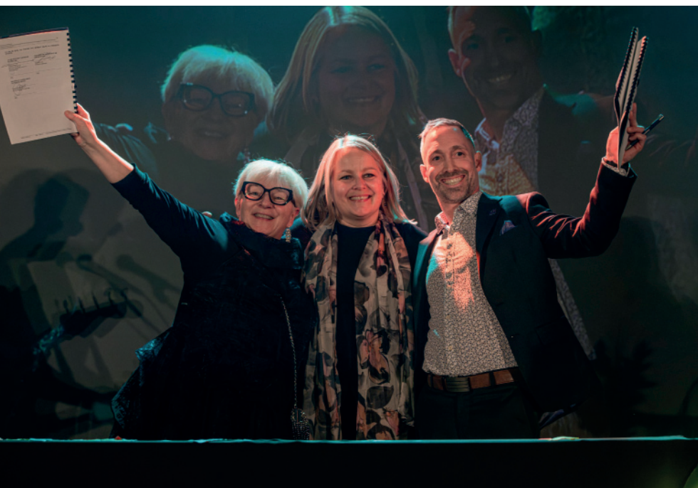
Signature du contrat de partenariat avec l'Hôtel-Casino de Charlevoix

Tous les détails : creezdesliens.com/gala-2024