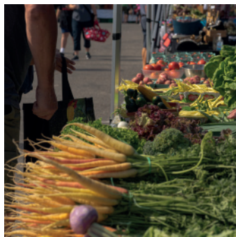
Marché de La Malbaie

Desjardins, Commission métropolitaine Québec-Lévis - Entente agricole & agroalimentaire, SADC Charlevoix, MRC de Charlevoix, MRC de Charlevoix-Est